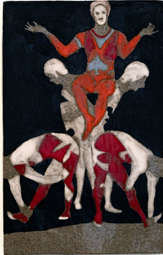
ליצנים, 2023, קרמיקה עם גלזורה וקרמיקה ואקריליק, 16.5x25.7 ס"מ Clowns, 2023, glazed ceramics and acrylic paint, 25.7x16.5 cm