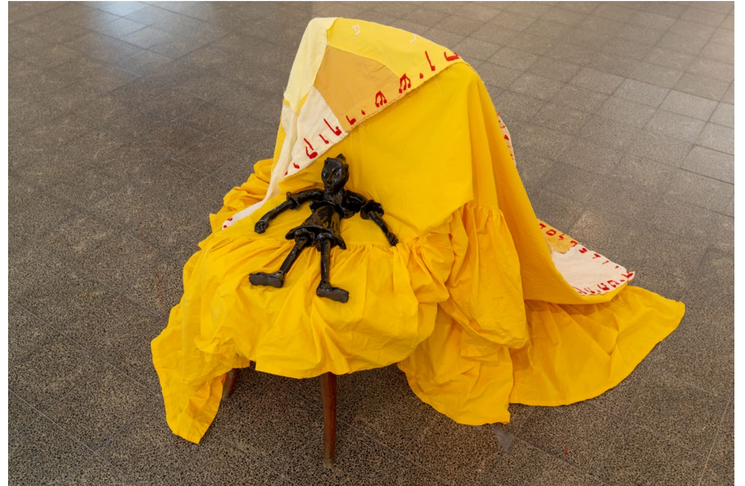
הכתרה, 2023, תפירה ורקמה על בד כותנה Coronation, 2023, embroidery and sewing on cotton כובסת, 2023, קרמיקה עם גלזורה שרופה Washerwoman, 2023, glazed ceramics