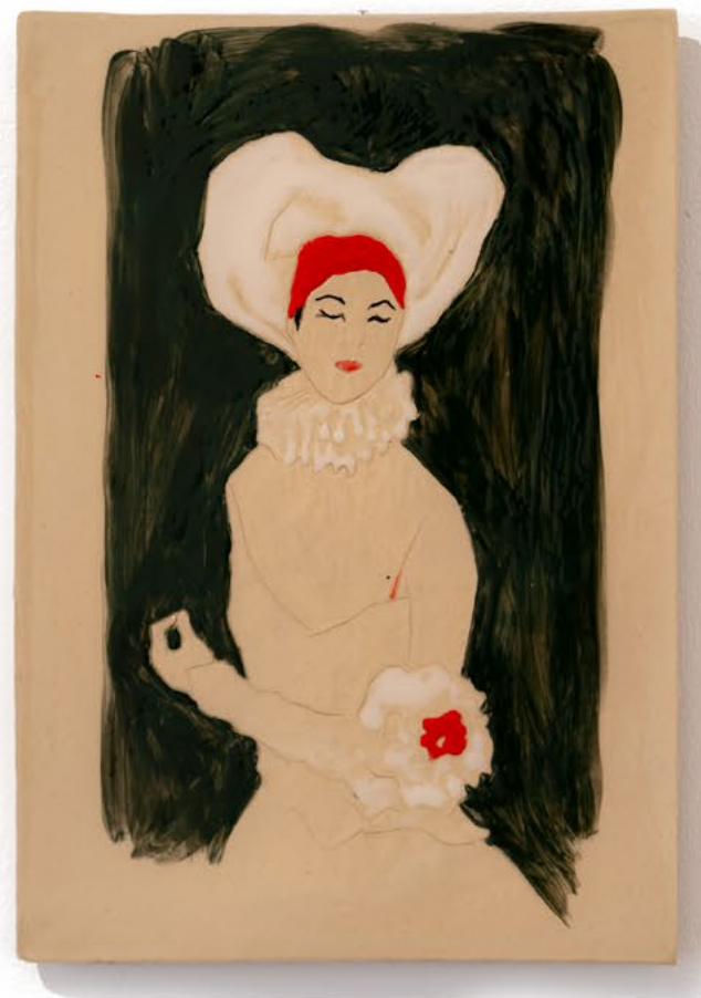
גברת, 2023, קרמיקה עם גלזורה שרופה ואקריליק, 18.5x26 ס"מ Mistress, 2023, glazed ceramics with acrylic paint, 26x18.5 cm