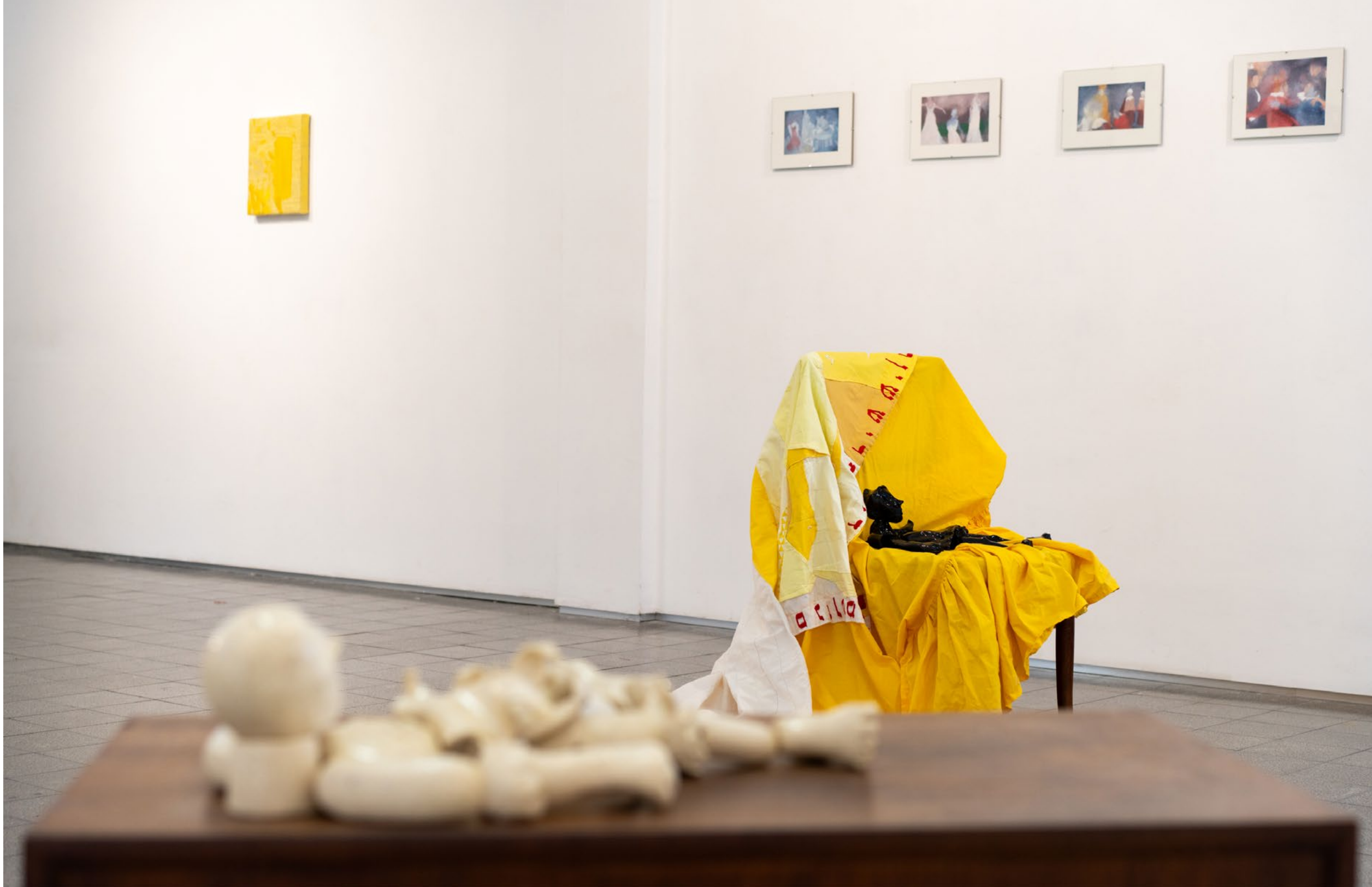
פטוניה, מראה הצבה בתערוכה Petunia, installation view