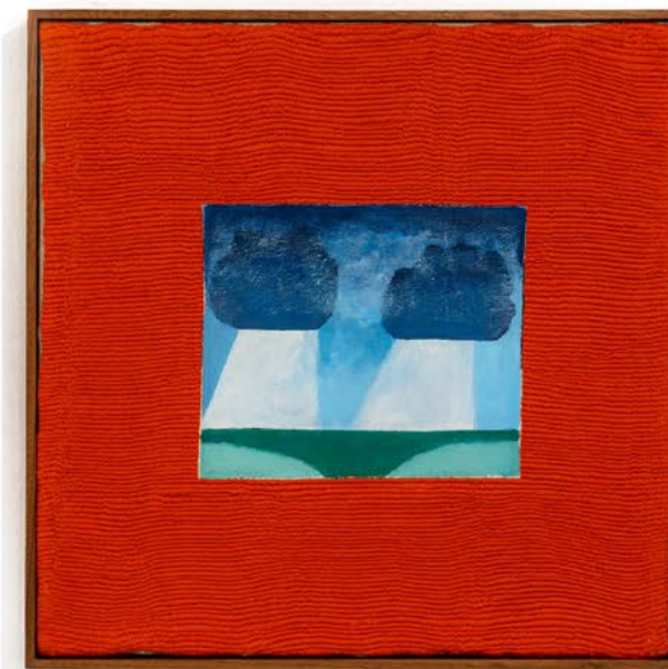
ללא כותרת, 2022, רקמה ידנית, כותנה וגואש על יוטה, 52.5x52 ס"מ Untitled, 2022, hand embroidery and gouache on jute, 52x52.5 cm