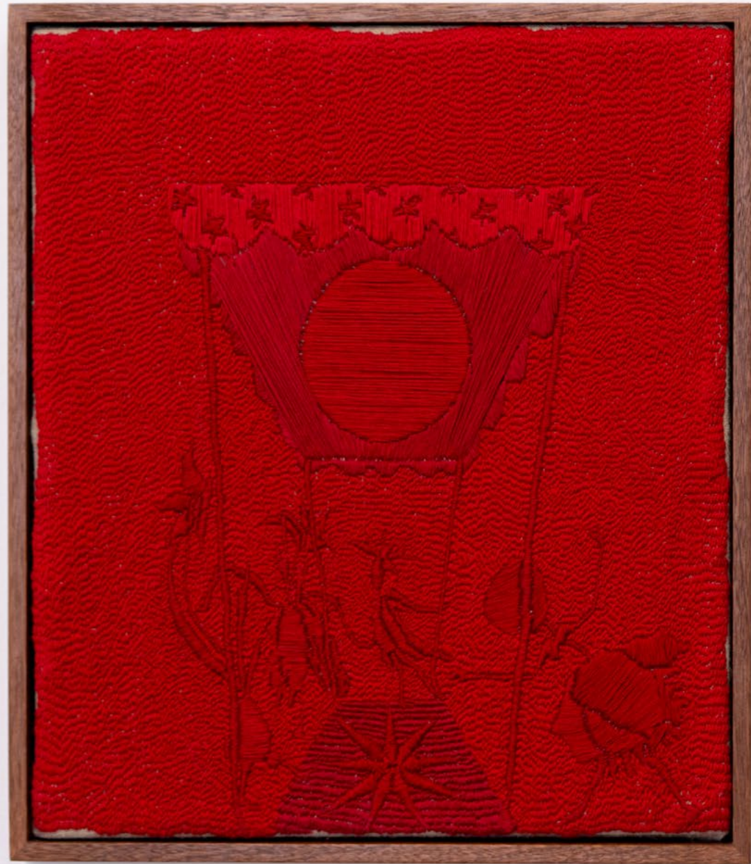
חופה, 2023, רקמה ידנית, חוט כותנה על יוטה, 32.8x37.7 ס"מ Canopy, 2023, hand embroidery on jute, 37.7x32.8 cm