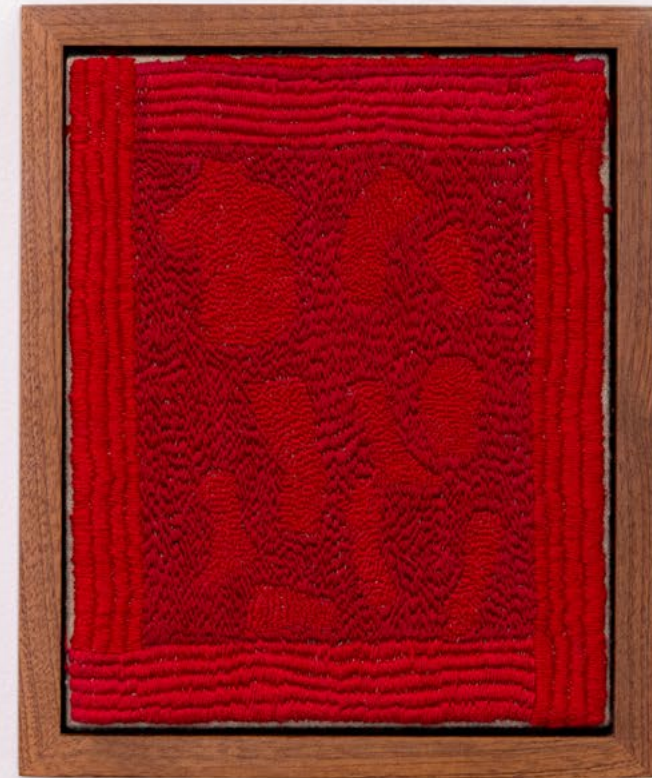
פילגוש, 2023, רקמה ידנית, חוט כותנה על יוטה, 19.5x23.5 ס"מ Concubine, 2023, hand embroidery on jute, 23.5x19.5 cm