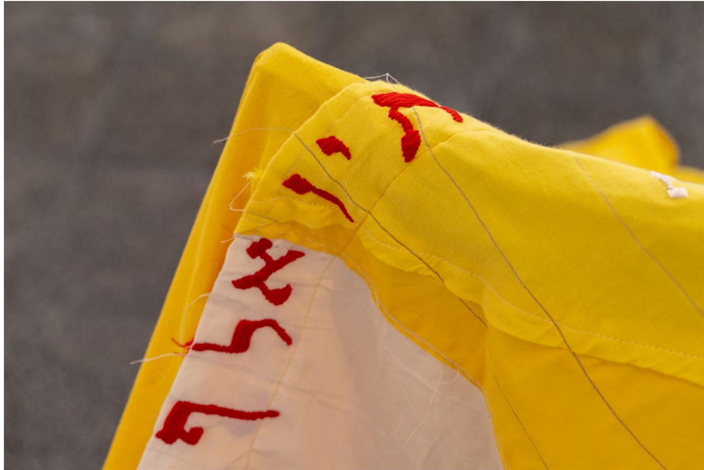
הכתרה (פרט), 2023, תפירה ורקמה על בד כותנה Coronation (detail), 2023, embroidery and sewing on cotton