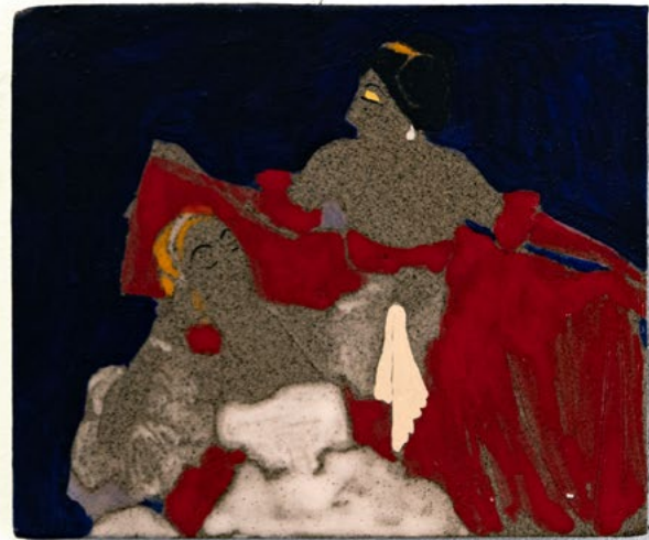
נשות החצר, 2023, קרמיקה עם גלזורה וקרמיקה ואקריליק, 18.5x15.7 ס"מ Court Women, 2023, glazed ceramics and acrylic paint, 15.7x18.5 cm