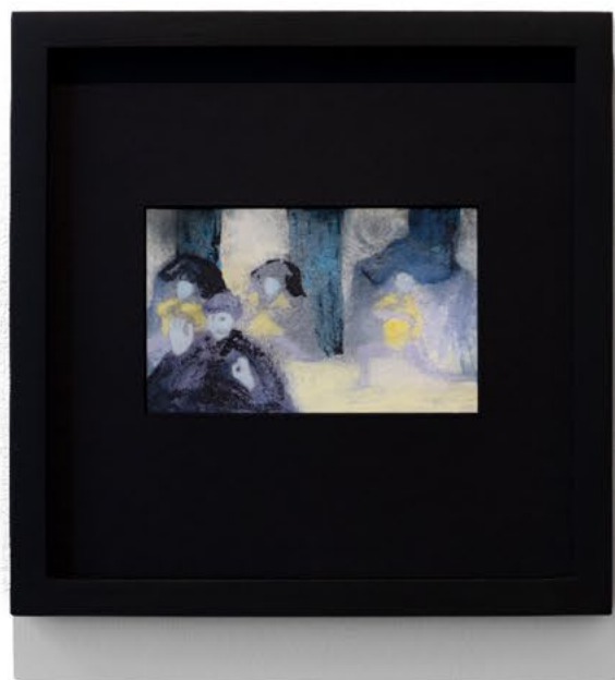
אשף, 2023, גואש על נייר, 33.5x33.5 ס"מ Wizard, 2023, gouache on paper, 33.5x33.5 cm