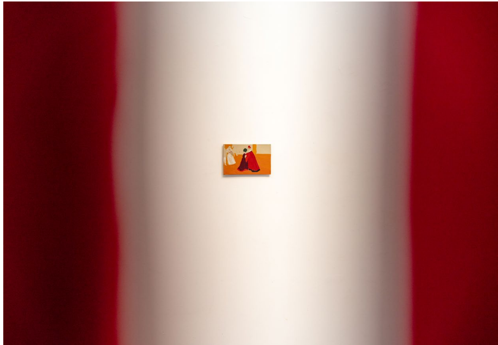
פטוניה, מראה הצבה בתערוכה Petunia, installation view