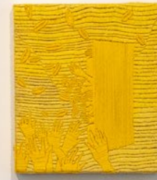
ללא כותרת, 2021, רקמה ידנית, חוט כותנה על יוטה, 30.5x35.5 ס"מ Untitled, 2021, hand embroidery on jute, 35.5x30.5 cm