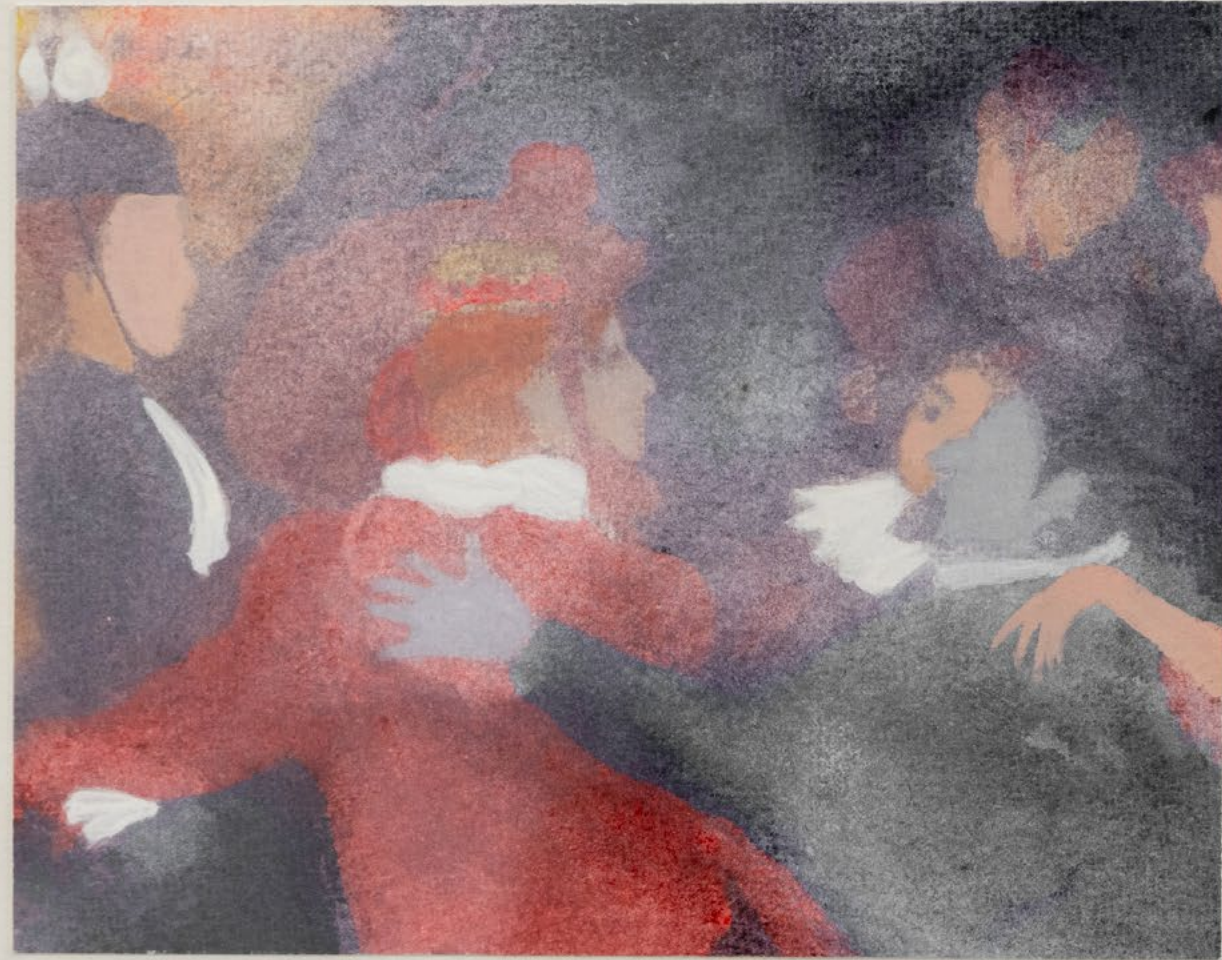
רקדניות, 2023, גואש על נייר, 30.5x30.5 ס"מ ה, Dancers