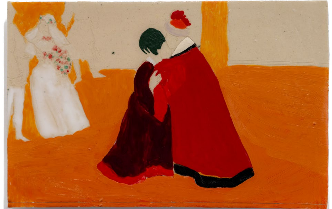
הנשיקה, 2023, אקריליק, קרמיקה וגלזורה שרופה, 20.5x13 ס"מ The Kiss, 2023, acrylic, glazed ceramics, 13x20.5 cm