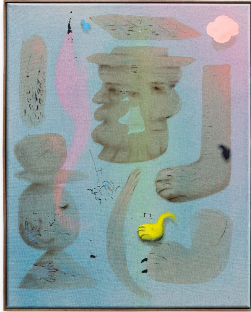
We Were Self Assured #3, 2022, watercolor, coffee, ink, acrylic and oil on canvas, 51 x 41 cm