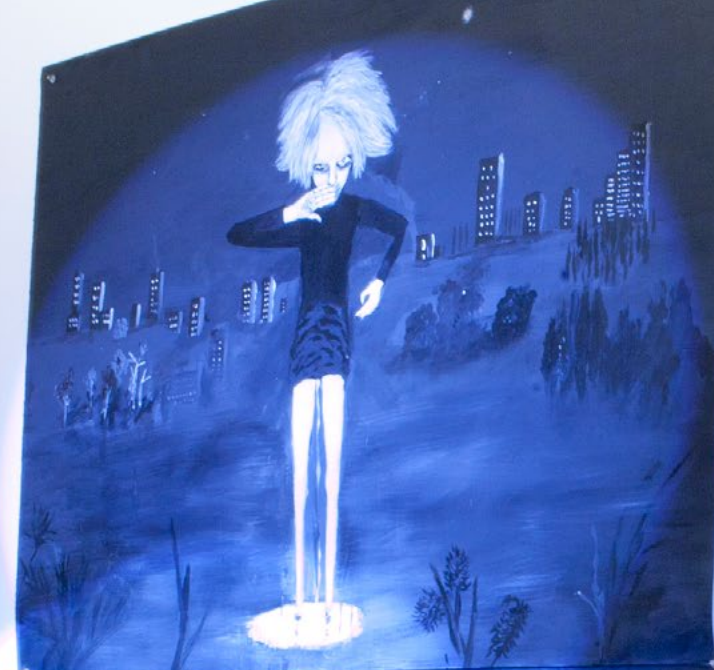
ללא כותרת, 2022, אקריליק על נייר, 145x220 ס"מ Untitled, 2022, acrylic on paper, 220x145 cm