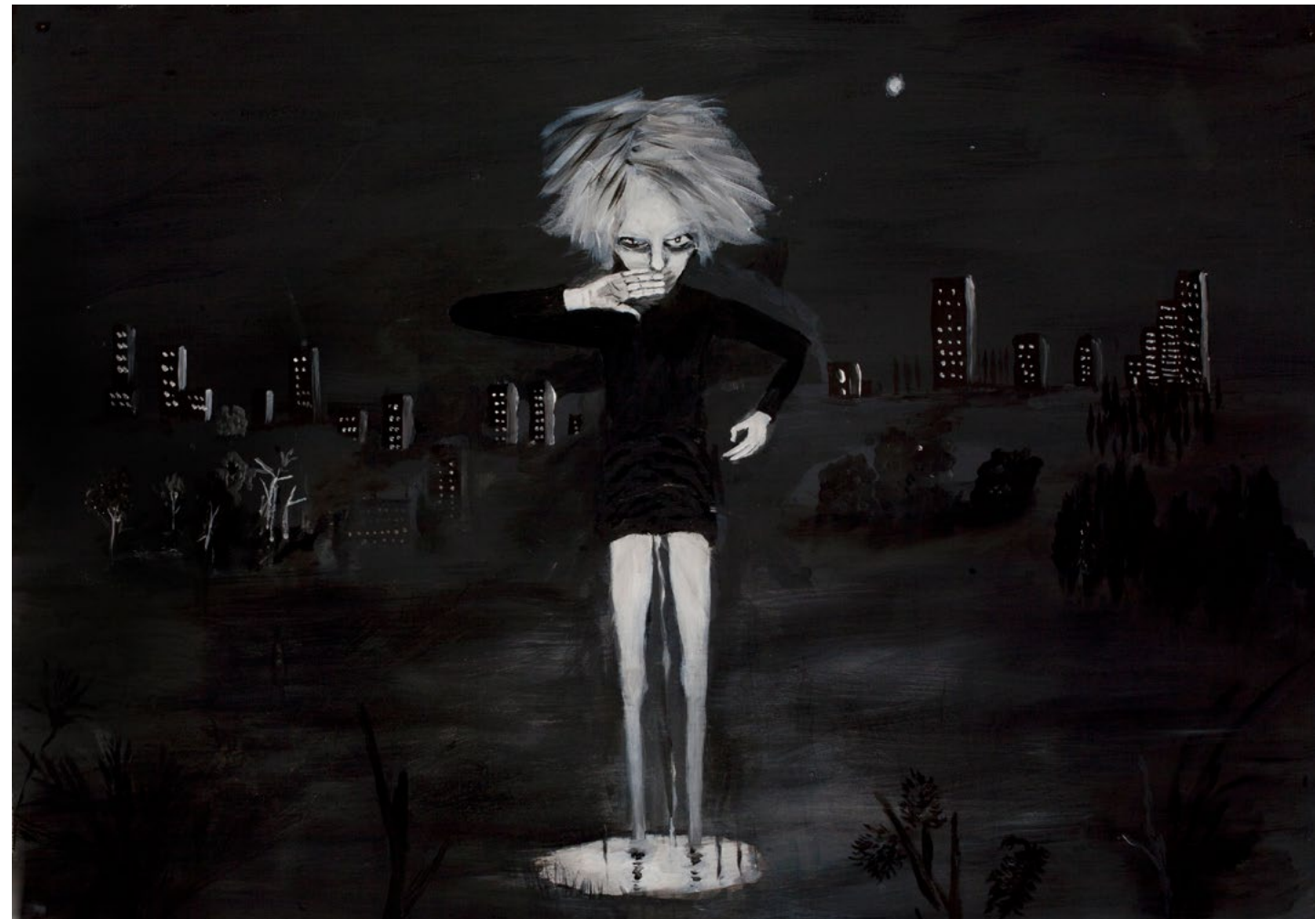
2022, אקריליק על נייר, 145x220 ס"מ (פרט) 2022, acrylic on paper, 220x145 cm (detail)