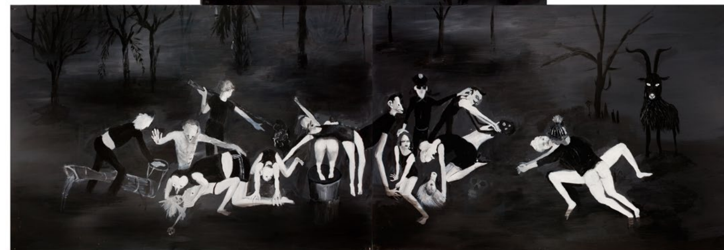
2022, אקריליק על נייר, 145x220 ס"מ (פרט) 2022, acrylic on paper, 220x145 cm (detail)