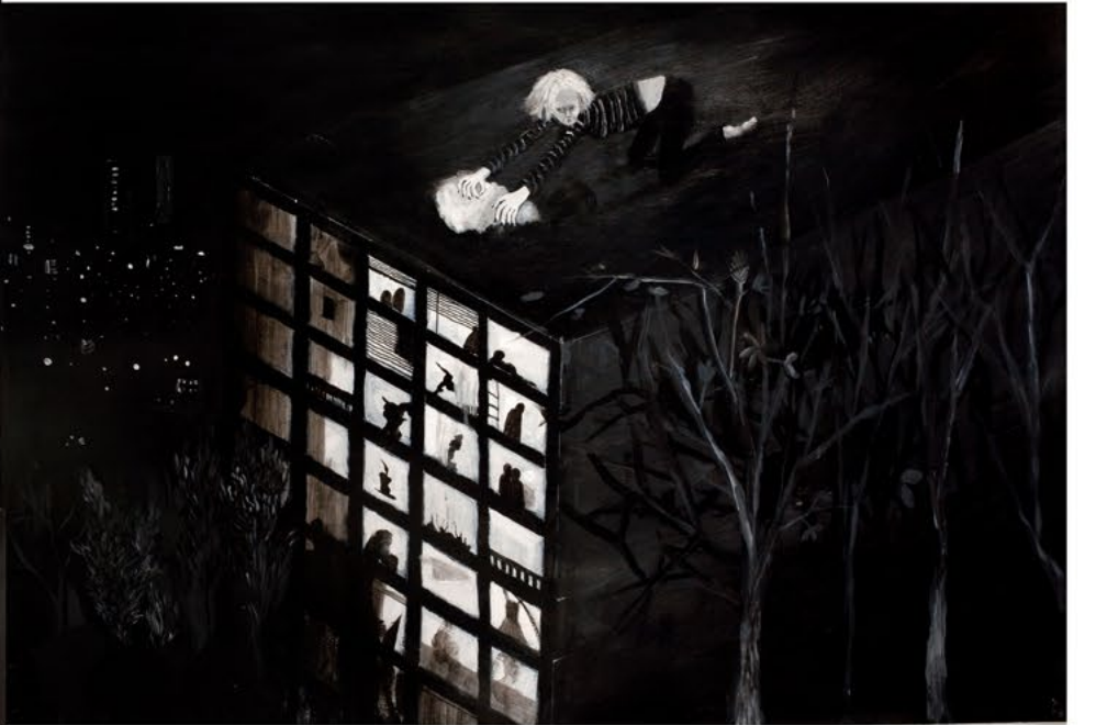
רחובות נטושים, 2022, אקריליק על נייר, 150x370 ס"מ Forsaken Streets, 2022, acrylic on paper, 370x150 cm