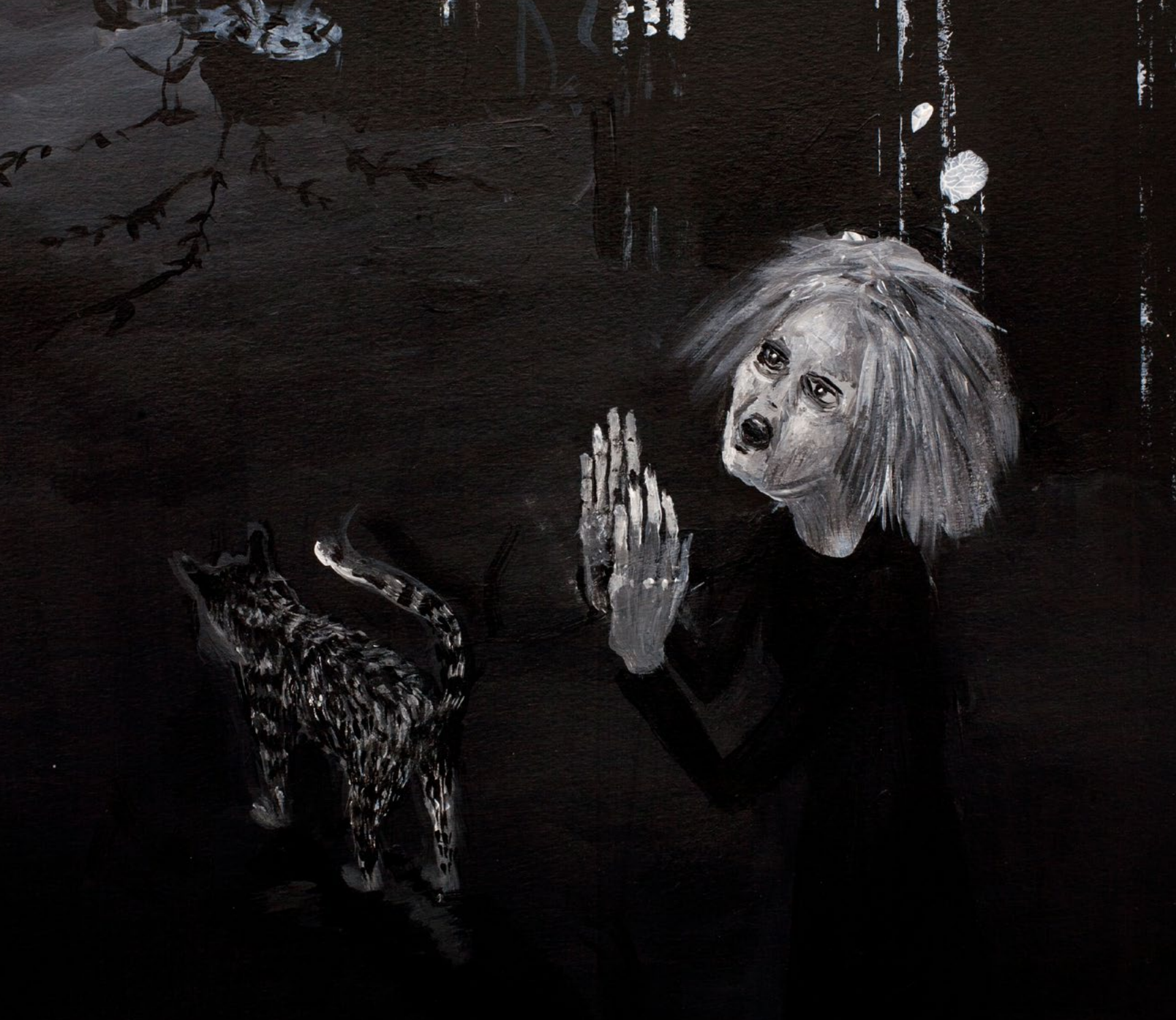
מסדר זיהוי (פרט), 2022, אקריליק על נייר, 223x110 ס"מ Identification Order (detail), 2022, acrylic on paper, 223x110 cm