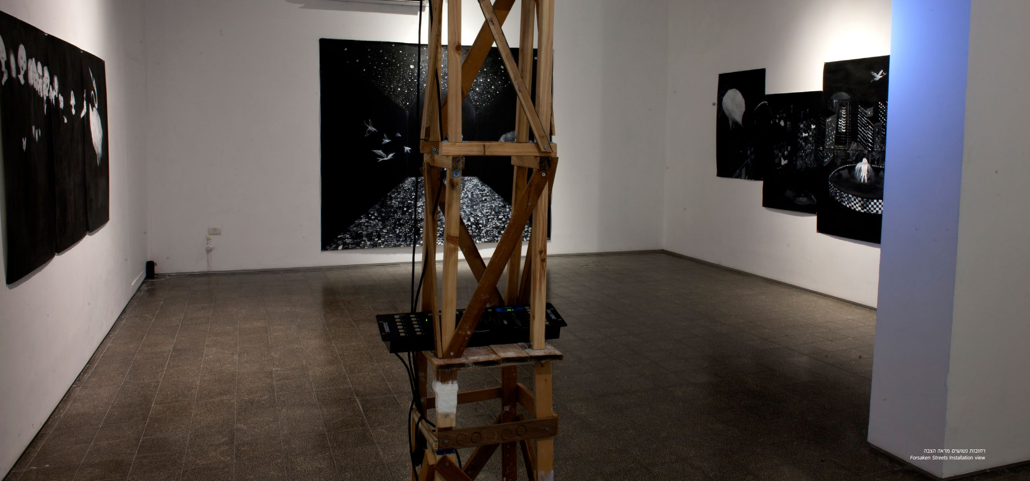
רחובות נושעים מראה הצבה Forsaken Streets Installation view