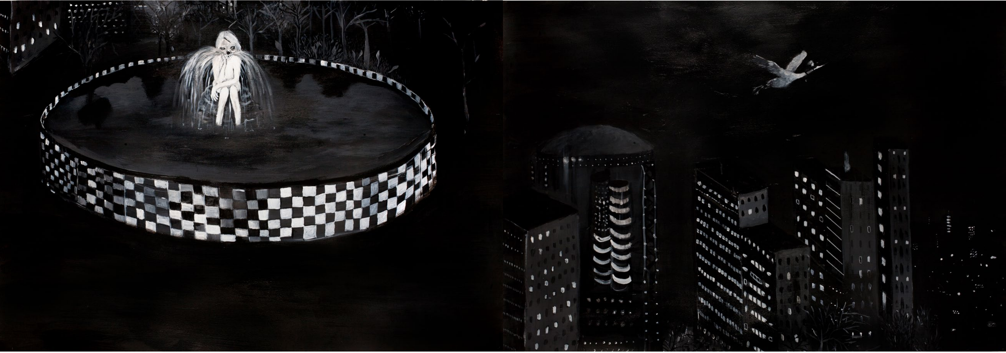
רחובות נטושים (פרט), 2022, אקריליק על נייר, 370x150 ס"מ Forsaken Streets (detail), 2022, acrylic on paper, 370x150 cm