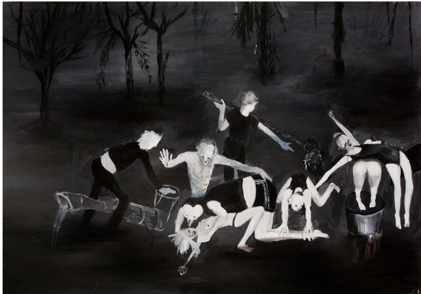
2022, אקריליק על נייר, 145x220 ס"מ (פרט) 2022, acrylic on paper, 220x145 cm (detail)