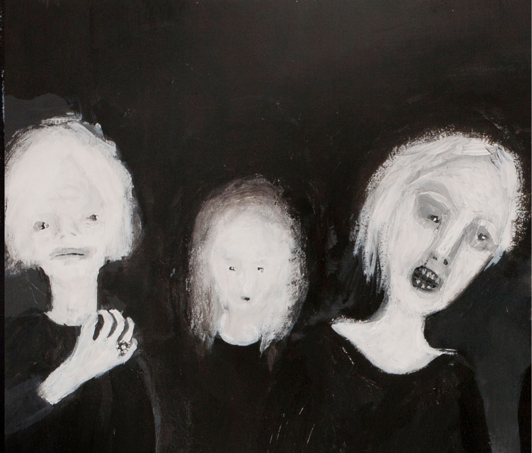
מסדר זיהוי (פרט), 2022, אקריליק על נייר, 223x110 ס"מ Identification Order (detail), 2022, acrylic on paper, 223x110 cm